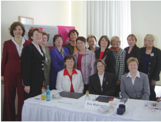
Der gewählte FU-Landesvorstand

Da die Geschäftsführung der Frauen-Union auf Landesebene nur ehrenamtlich arbeitet, konnte die Pflege und Betreuung der Mitgliedskreisverbände nur im Rahmen unserer Möglichkeiten gestaltet werden.